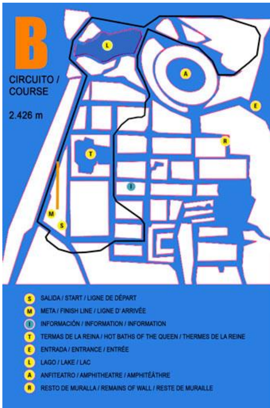
CIRCUITO B CATEGORIA COMPETICIÓN FANDDI 1 VUELTA